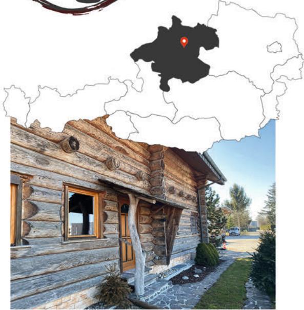
Eingang Büro Foller GmbH

auf der B1 - Salzburger Straße Richtung Wels bis nach Marchtrenk fahren - in Marchtrenk auf die Eichenstraße einbiegen und den folgenden Kreisverkehr an der zweiten Ausfahrt verlassen - dem Straßenverlauf Richtung Oftering auf der L1227 - Paschinger Straße folgen bis die Ortseinfahrt von Jebenstein - Gemeinde Holzhausen erreicht ist - nach der Ort- Einfahrt in die erste Straße auf der rechten Seite einfahren.